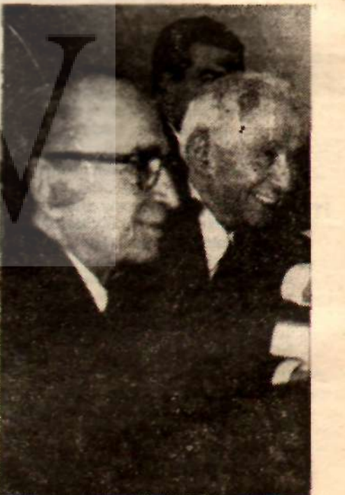
... Ve Gümüşpala ile ...

Bu arada, aylardır için için sürüp giden CKMP içindeki buhran, sert bir şekilde patlak verdi. Peşinden yüzlerce milletvekilini sürükleyen büyük bir muhalefet lideri olarak «gününi beklemek» rüyasını gören Bölükbaş, 28 milletvekili ve senatörle birlikte partiden istifa etti. CKMP'nin öbür yöneticileri ise, koalisyona girme sevdası peşindeydiler. Fakat Bölükbaşın istifası üzerine, acele toplanan Genel İdare Kurulu, ilk üçlü koalisyon fikrinden derhal cayıp «biz ancak millî bir koalisyona gireriz» türküsünü çağırılmaya başladılar. İlk koalisyonda otobüsü kaçırın Alican partisi ise, geçen seferki hâlayı bir daha işlememek için, erkenden koalisyon otobüsünü durdurma geldi ve beklemeye başladı.