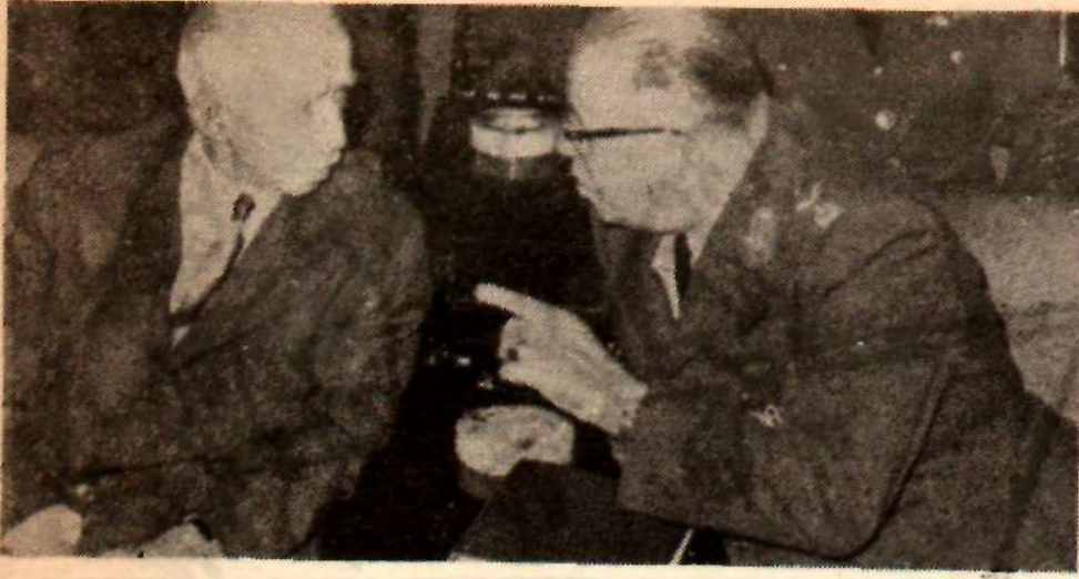
... Genel Kurmay Başkanı Sunay ile ...

İki parti arasında ahenkli çalışma usullerini aradık. Af meselesinde itilâflar büyüdü. Bazan mutabakata vardık, tanımadılar, sözlerinde durmadılar. Tekrar müzakere ettikler, ikkiye ayırdılar. Mücadele ettikler ve neticede kararları hükümetinkini red etmek oldu. Bu karar hükümetin istifası ile sonuçlandı, bugün sabahtan beri de istifa işleri üstüne konuştuk. Bakanlarına istifa edelim, çalışmıyoruz dedim, kendi gruplarında terâki olduğunu söylediler. Grubumuzun tekrar toplanmasına müsaade edin dediler, dedi.