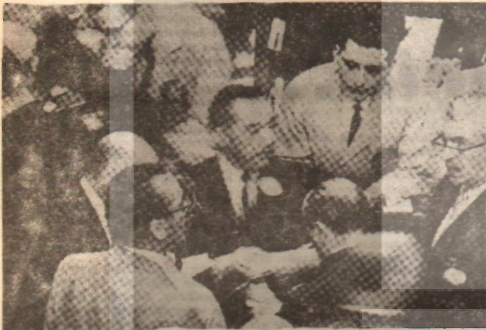
23 Mayıs günü New York Borsasının görünüşü

1929 buhranı 28 Ekim'de zirvesine ulaşan bir panik havası kadar ve belki ondan ziyade kapitalist ekonomi buhranlarına karşı savaş silahlarının bilinmeyişi sebebiyle o derece tahripkâr sonuçlar doğurmuştur. Bu tarihe kadar, bu gibi konjonktürel iniş ve çıkışlara müdahale edilemeyeceği, hattâ edilmemesi gerektiği yolundaki teorik zemin, buhranın çıkması kadar şiddetlenmesinde de büyük rol oynamıştır. Bugün buhranla savaş silahları bellidir ve belli olduğu için de 1929 dan beri bu tarihe kadar o çapta bir buhrana rastlanılmamıştır. Nitekim Amerikan ekonomisi 1913 tenberi konjonktürel iniş ve çıkışlara maruz bulunmaktadır. Ancak 1929 a kadar bu dalgalanmalar şiddetliydi. Yani yükse-